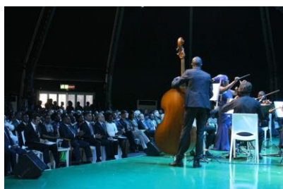
Actuação do Xiquitsi na Conferência Internacional do Turismo baseado na Natureza