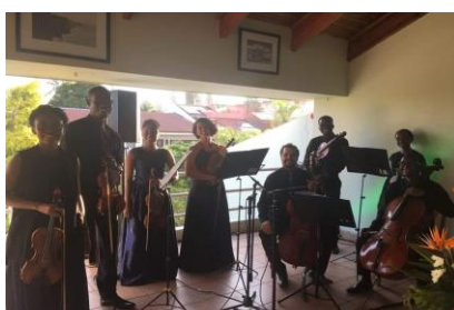
Xiquitsi no Dia Nacional da Irlanda na Residência Oficial do Embaixador em Maputo