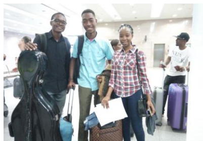
Viagem de três alunos do Xiquitsi para estágio em Portugal e sua actuação no Festival de Música da Primavera na cidade de Viseu.