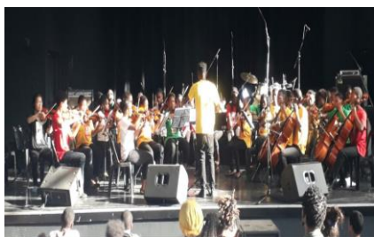
Participação do Xiquitsi na Festa da Música no CCFM