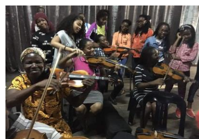
Aula musical para Pais e Encarregados de Educação dos principiantes do Xiquitsi