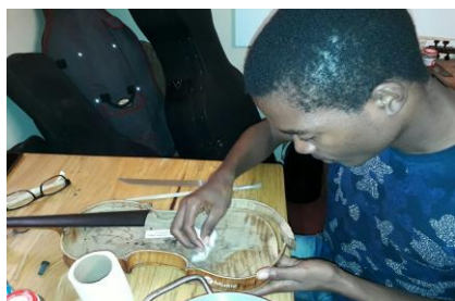
Formação de alunos do Xiquitsi em luthieria ( arranjo de instrumentos)