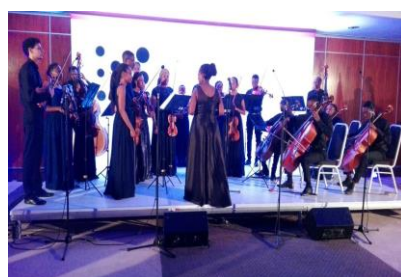
Dia Nórdico no Indy Village