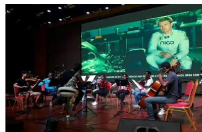
Coro e Orquestra Xiquitsi na abertura do jogo da Liga dos Campeões em Maputo