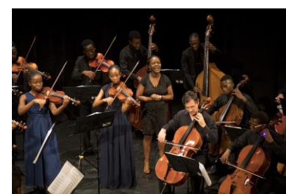
Momentos da segunda série do Xiquitsi